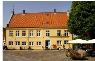
Touristinfo auf dem Marktplatz

Der alte Marktplatz Torvet ist umgeben von vielen hübschen Gebäuden. Auch die Touristinformation befindet sich auf dem Marktplatz wie auch das Klosterbagerens Hus , das älteste Haus von Tonder, die ehemalige Klosterbäckerei. Auch die Christkirche , mit den 14 aufrecht stehenden verzierten Grabplatten, wäre ein Besuch wert. (je nach Laune von Andy).