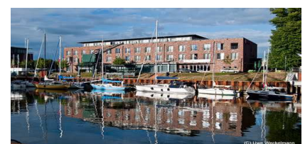
Hotel Ramada Stade

Den Abend werden wir in diesem hübschen Dörfchen ausklingen lassen.